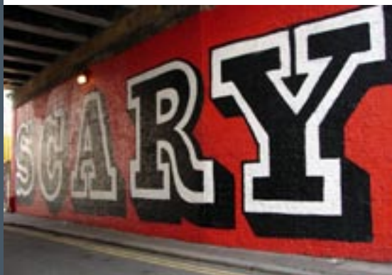
Straatbeeld Londen (detail)

De galerieagenda is verkrijgbaar bij galleries, zie ook www.artupdate.com/london . Het aardige aan deze folder is dat de galleries van New York op de achterzijde staan vermeld.