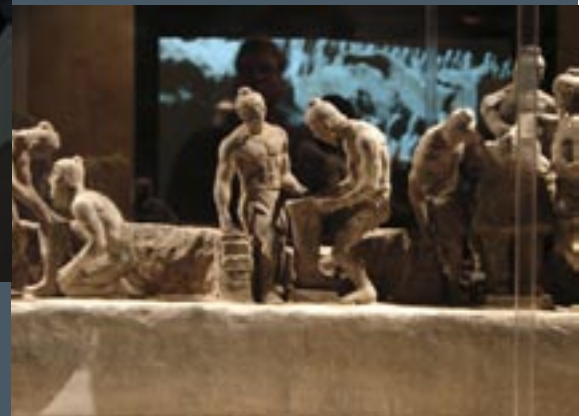
The making of... het Terracottaleger

Heddon Street, een zijstraatje van Regent Street – is overigens niet zo gemakkelijk te vinden. Staat soms vreemd genoeg ook niet vermeld in de galeriefolder. Vreemd, omdat deze galerie verschillende plekken in de stad heeft en bepaald geen kleintje is in de wereld van avant-garde kunst. Haar galerie in deze wijk bevindt zich op de eerste en tweede etage. De galerie heeft een geweldige reputatie – met grote Brit Art namen – en in tegenstelling tot andere galleries op dit niveau, wordt de bezoeker hier uiterst aangenaam ontvangen. De hierboven genoemde galeriewandeling duurt een hele dag. Met lunchpauze in begrepen.