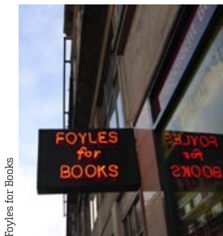
Foyles for Books

Selectie van goede vintagewinkels in Londen. In Cheval Street zijn enkele hele goede te vinden, hebben ruime keus bekende merken, kleine winkeltjes met merken als Chanel, Dior, Prada. Pandora, Salou en The Dress Box liggen op een rijtje praktisch naast elkaar. Van tassen tot schoenen en alles wat daartussen in zit. Vermeldenswaardig is dat je bij deze winkels nog Birkin tassen van Hermes vindt. Prijzig dat weer wel, maar voor deze tassen bestaan enorme wachtlijsten. Dus als je echt een Birkin wilt, ga naar Cheval Place. Befaamd in Londen is ook Bricklane. In dit straatje vind je goede tweedehands winkels en vintage. Rokit (Bricklane nummer 107), Public Beware Co. LTD, op nummer 91. Hier vlakbij ligt de Old Truman Brewery, een omgeving met vele boetiekjes. Junky Styling, 12 Dray Walk is noemenswaardig.