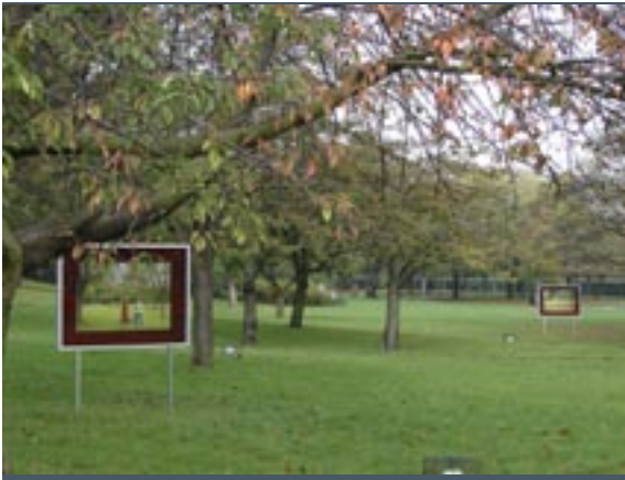
Regent's Park tijdens de Frieze Art Fair