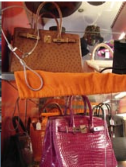
Birkin tassen bij Pandora