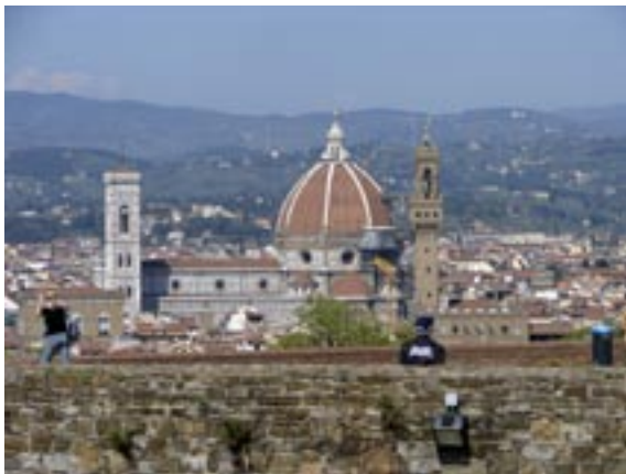
Zicht op Florence