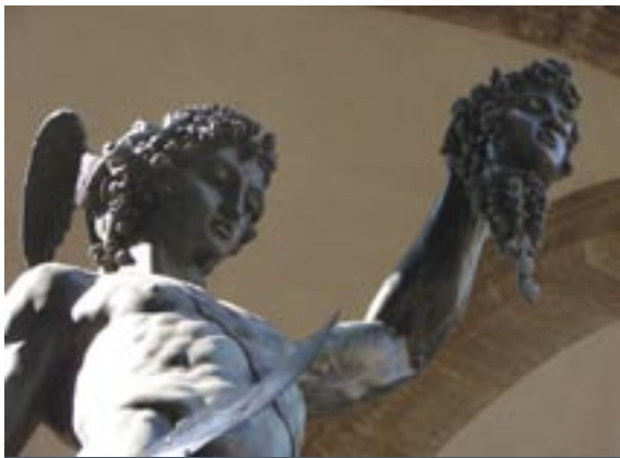
Perseus van Benvenuto Cellini