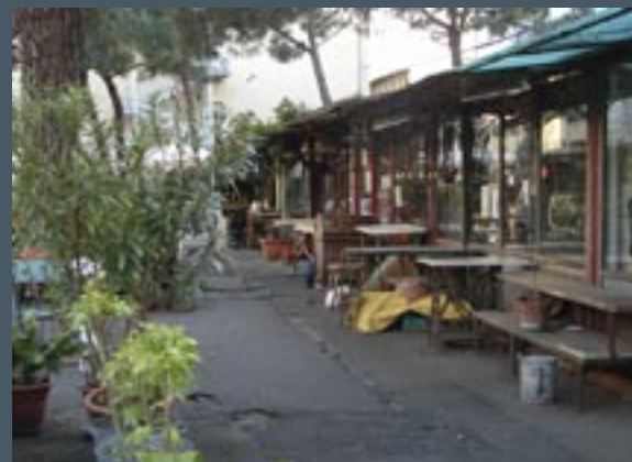
Piazza del Campi