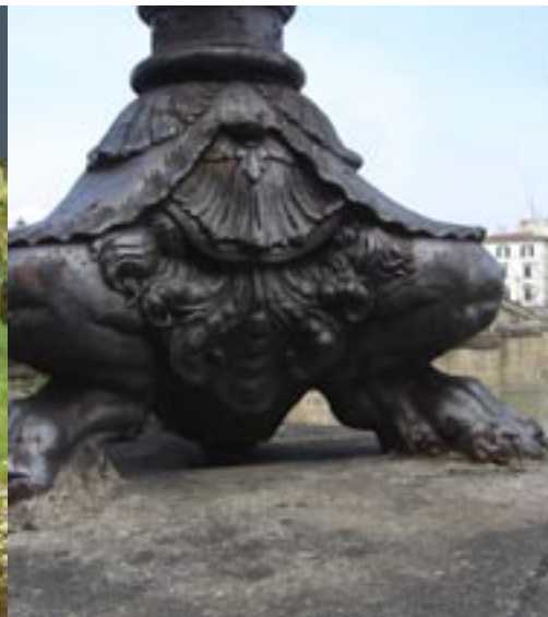
Detail straatantaarn aan de Arno