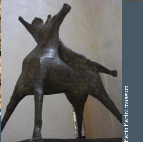
Mario Marini museum