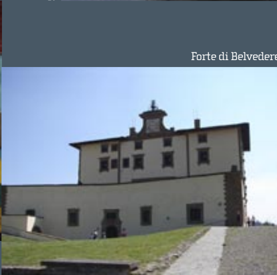
Forte di Belvedere