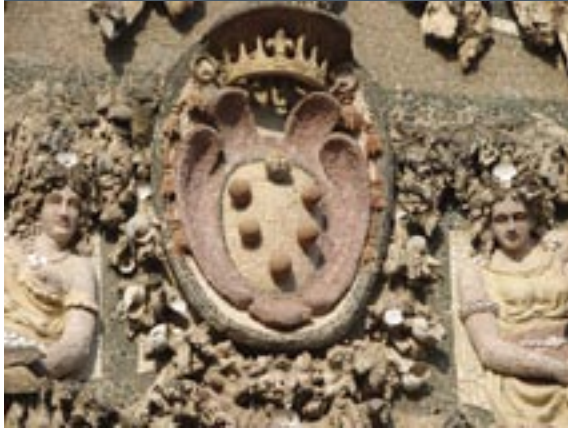
Boboli tuinen, Medici wapen