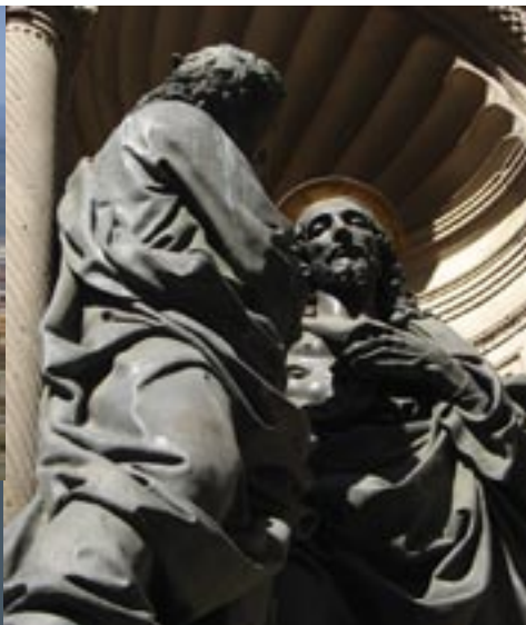
Orsan Michele (detail)