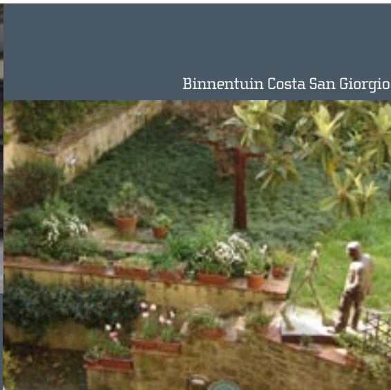
Binnentuin Costa San Giorgio