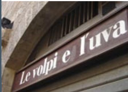
Wijnbar Le Volpi e L'uva

Semolina, Piazza Lorenzo Ghiberti, 87, enigszins verborgen restaurant waar veelal alleen Florentijnen zijn te vinden. De tonijn op de kaart is fenomenaal.