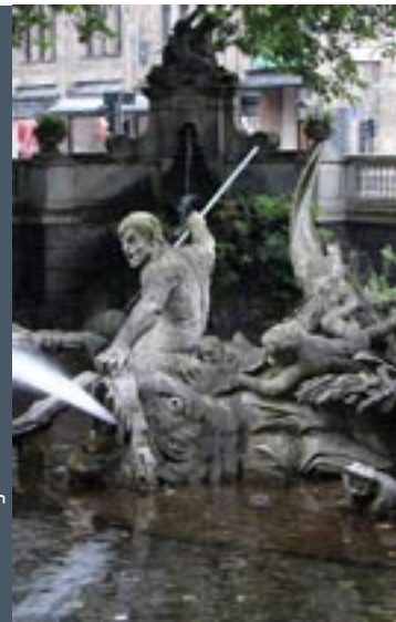
Fontein in gracht ad Ko