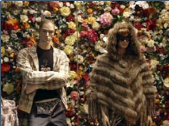
Kult aan de Ko