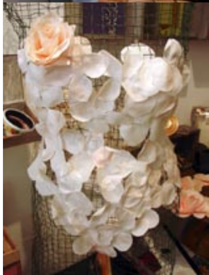
Body van zeep bij Galerie Cebra