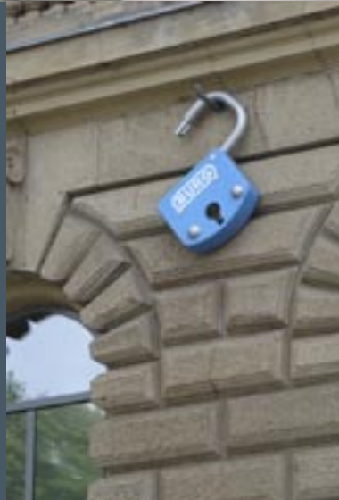
Detail gevel K21