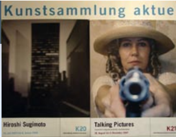
Affiches K20 en K21