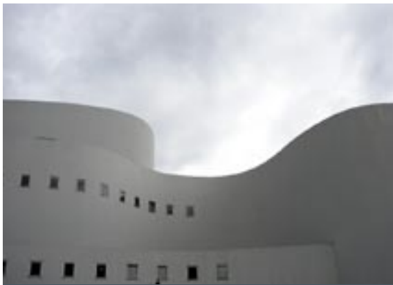
Detail gevel Schauspielhaus