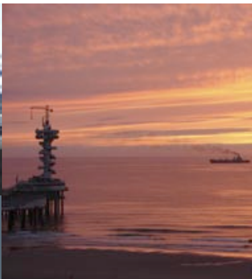
Mooie luchten en foelieijke pier van Scheveningen