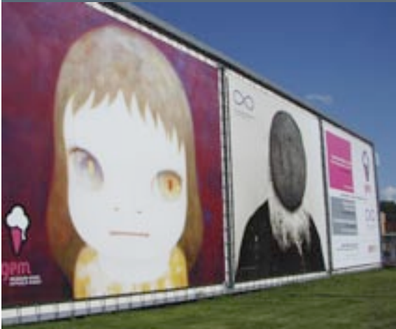
GEM en Fotomuseum Den Haag