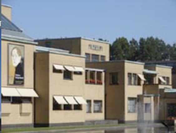
Gemeentemuseum Den Haag