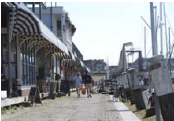
Restaurantjes in haven Scheveningen