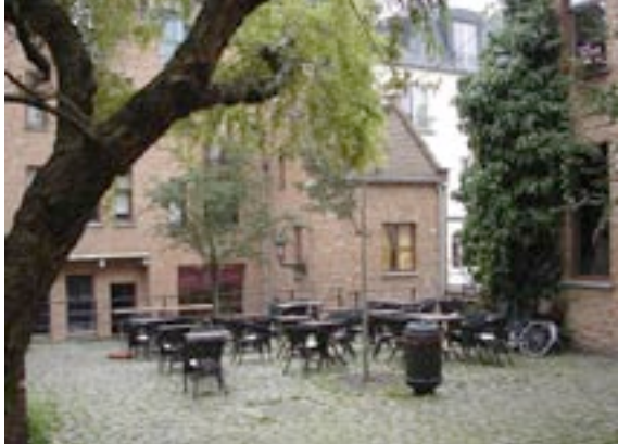
Terras aan het eind van de St. Jacobsgang