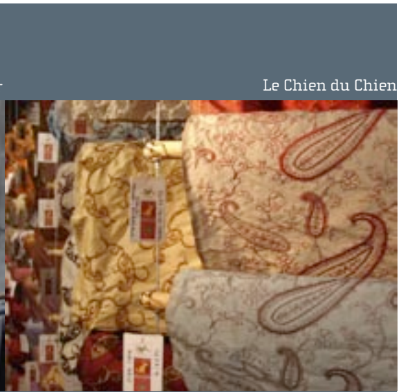
Le Chien du Chien