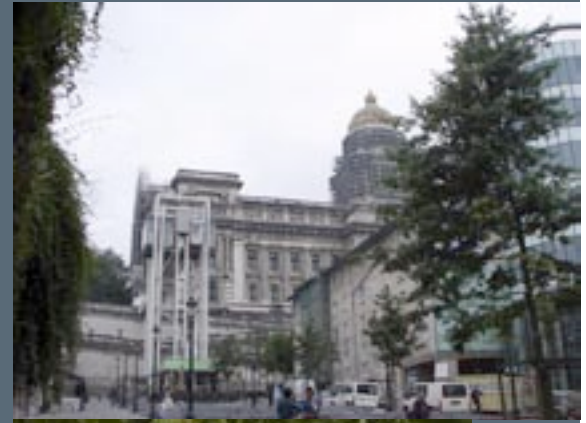
Verbinding bovenstad en benedenstad