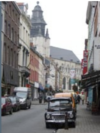
Blaesstraat in de Marollenwijk