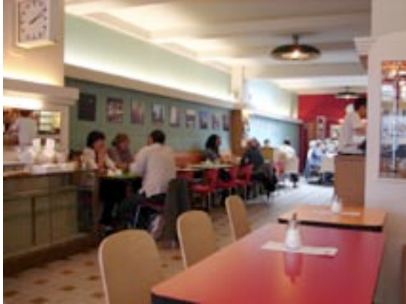
Stadskantine in de Marollenwijk