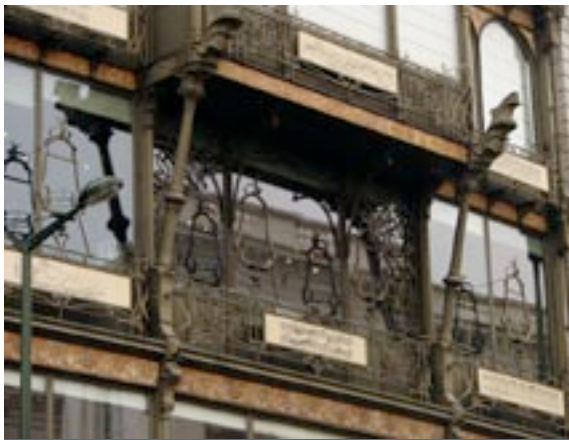
Old England, detail