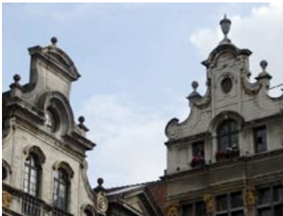
Grote Markt, detail