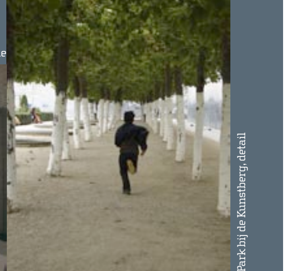
Park bij de Kunstberg, detail