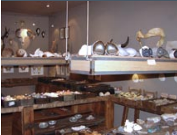
Steen en Been