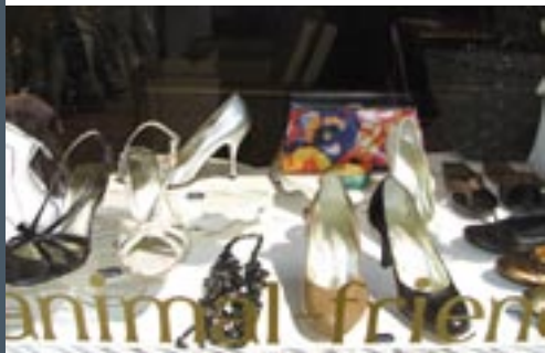
Georgette, vegetarische schoenenwinkel

zeggen: geen wol, geen bont, geen zijde, geen leer, kortom, een 'must' voor vleesweigeraars!