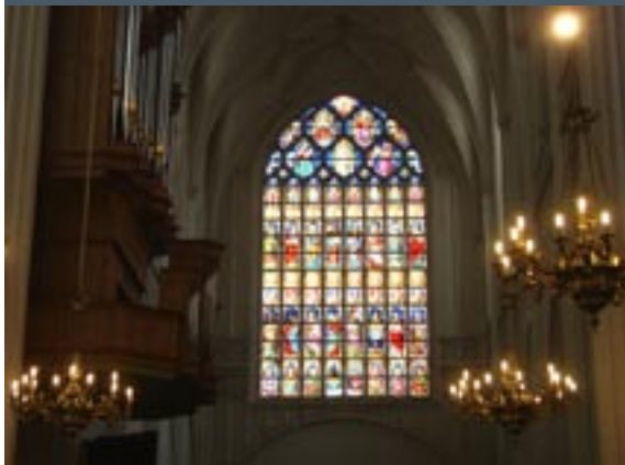
Onze Lieve Vrouwe Kathedraal