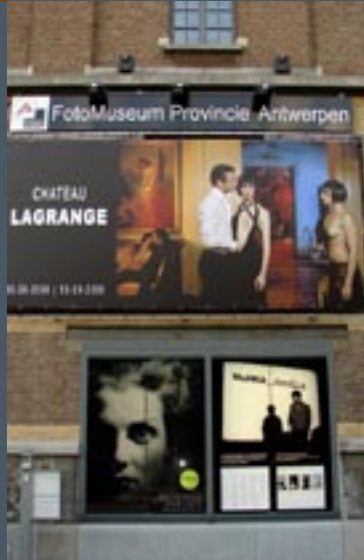
Fotomuseum van de provincie Antwerpen

op de balie. Deze zweeft als het ware en beweegt licht als je er per ongeluk tegenaan loopt. Ook een bezoek aan het pand waarin Ann Demeulemeester huist, is geen verloren tijd.