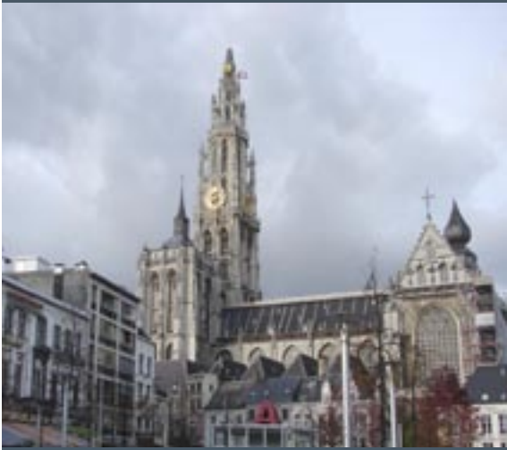
Rubens op de Groenplaats