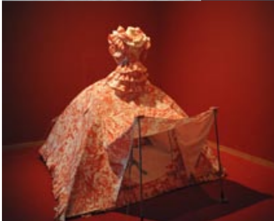
Icelandic Love Corporation