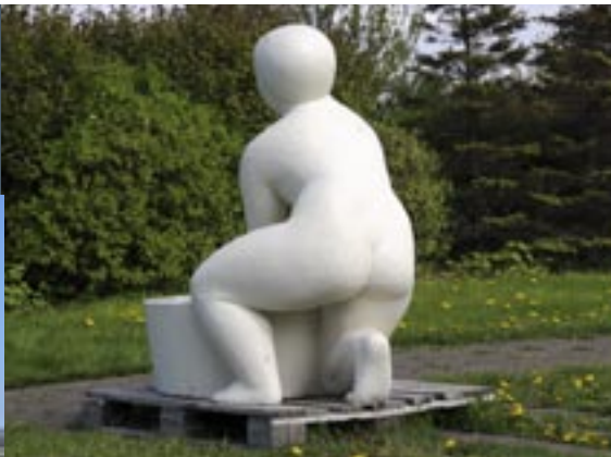
Beeld van Ásmundur Sveinsson