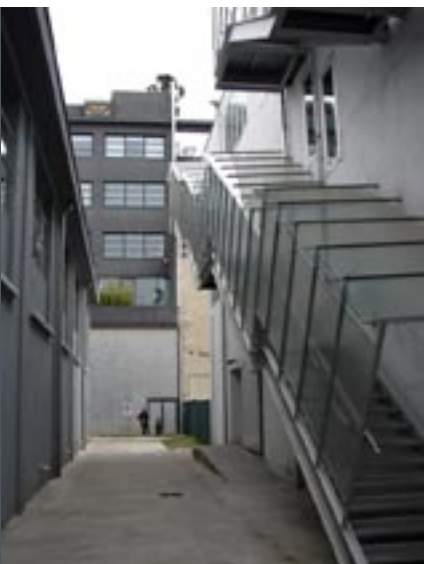
Kunst in kantoor Mariano Pichler