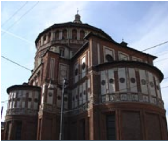
Santa Maria Delle Grazie