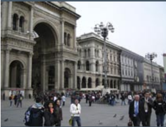
Galleria Vittorio Emmanuele II