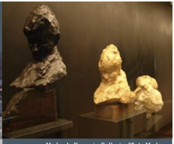
Medardo Rosso in Galleria d'Arte Moderna