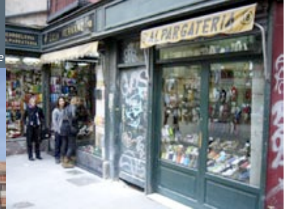
Handgemaakte espadrilles op Toledo

de toegangsdeur. Wat een wonderlijke ervaring is. Op het dak zijn vervolgens toevoegingen gedaan waarbij de voormalige gevel echter in stand is gehouden. Oud ontmoet nieuw op een zeer verrassende wijze. Het pand heeft geen tuin, maar aan het ernaast gelegen gebouw is tegen de gevel een 'tuin' ontworpen door de botanist Patrick Blanc. Fotogeniek. Het Caixa Forum ligt tussen het Reina Sofia en het Prado. Absoluut niet overslaan dus tijdens je museumdag.