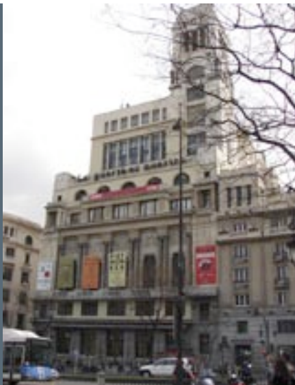
Circolo de Bellas Artes de Madrid