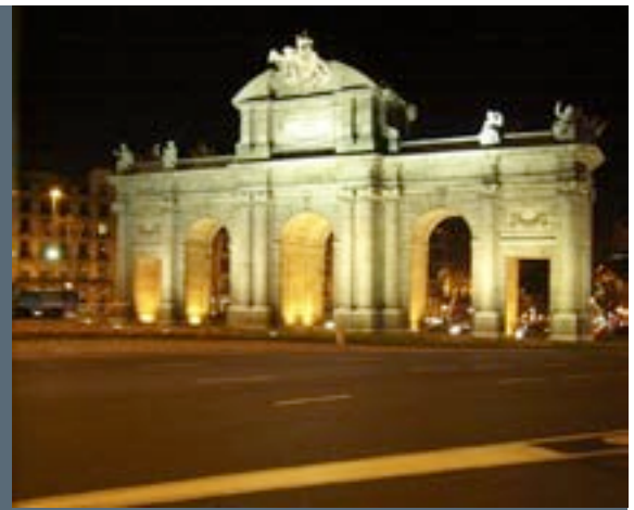
Porta de Alcalá