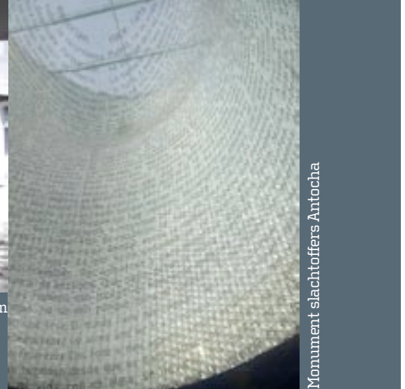
Monument slachtoffers Antocha

bombardement op het Baskische Guernica. Toen was Spanje nog onder de heerschappij van de fascist Generaal Franco. Guernica was een republikeins bolwerk en Franco wilde hiermee korte metten maken. Wat hem aardig is gelukt, want de hele stad werd vernield. Vanzelfsprekend staan voor de Guernica van Picasso drommen toeristen. Is het te druk om het schilderij goed te zien, kun je het beste eerst andere werken van Picasso op deze verdieping gaan bekijken. Van sculpturen tot tekeningen en schilderijen; wist je weinig van deze kunstenaar, ben je meteen een heel eind verder als je deze etage van het Reina Sofia bezoekt. Het museum is enorm van formaat, zaal na zaal na zaal tref je grote namen aan. De Spaanse kunstenaar Tapiès is hier uiteraard sterk vertegenwoordigd. Wil je niet de hele dag in dit museum zijn, beslis dan van te voren in welke periodes en namen je bent geïnteresseerd.