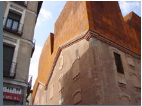
Caixa Forum, gebouwd door Herzog & De Meuron (detail)