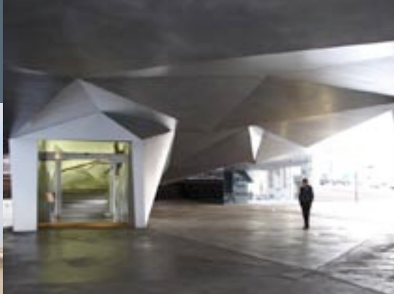
Ingang Caixa Forum