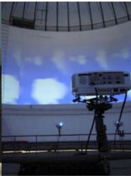
Installatie Eder Santos