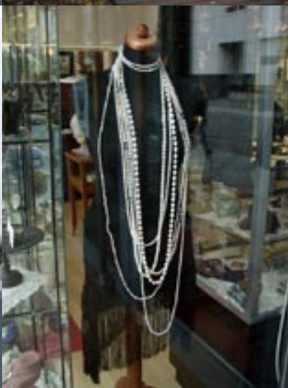
Antieke juwelen op de G. Georgenstraße