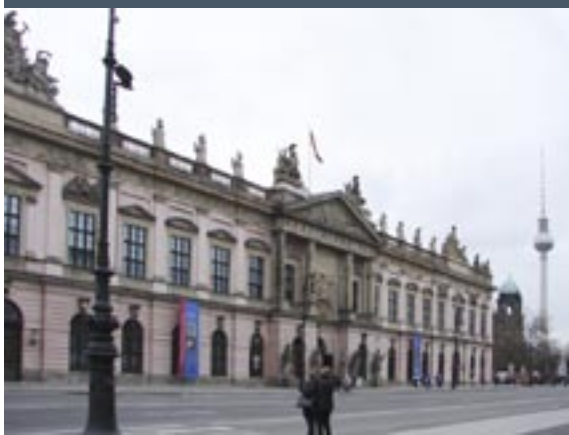
Unter den Linden [detail]