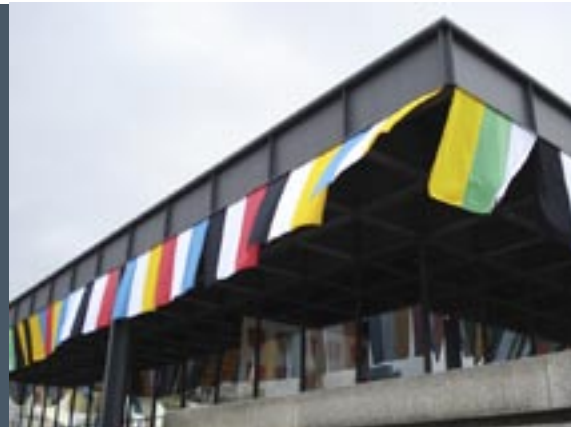
Neue Nationalgalerie tijdens Berlin Biënnale 2008