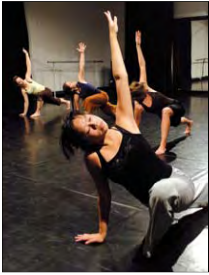
Do, Moderne dans door Sanne van der Put .